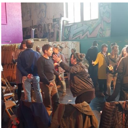
Crashkurs Argumentieren gegen Stammtischparolen

Mit unserem Rahmenprogramm verfolgten wir dieses Jahr zwei Stränge weiter, welche uns bereits in den vergangenen Jahren zunehmen interessierten: das Angebot von Crashkursen zu passenden Themen und die Weiterentwicklung des Formates des Publikumsgespräches. Die Crashkurse zu kommunikationsrelevanten Themen (Gebärdensprache, gendergerechtes Diskutieren, Zivilcourage und Argumentieren gegen Stammtischparolen) zogen alle viele Teilnehmende an und wurden von viele als Bereicherung des Theaterprogramms bewertet.