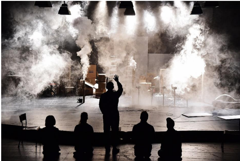
Girl From The Fog Machine Factory

die Krawalle am Vorabend auf den Strassen um die Reitschule herum gewesen sein. Möglicherweise hielten die Nachrichten am Tag darauf einige Familien vom Besuch ab.)